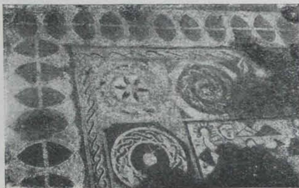
Fig. 577. — Detall dels mosaics de Tossa

L'INSTITUT D'ESTUDIS CATALANS es proposa auxiliar les excavacions, esperant poder-ne publicar un estudi més complet en l'ANUARI següent. — JOSEP PUIG I CADAVALCH.