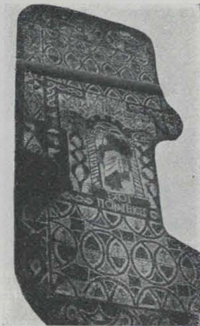
Fig. 576. — Detall amb figures i inscripcions dels mosaics de Tossa

El de l'extrem en la fotografia (fig. 575) és d'una combinació de formes triangulars i quadrades, usual en la arquitectura romana; el que segueix (fig. 576) conté en son centre la representació d'un pòrtic amb triple arcada sobre columnes de canya ornada en forma helicoidal, amb capitell acampanat de fullatge; en el tram del centre hi ha una figura varonil vestit amb túnica i abrigat amb la toga.